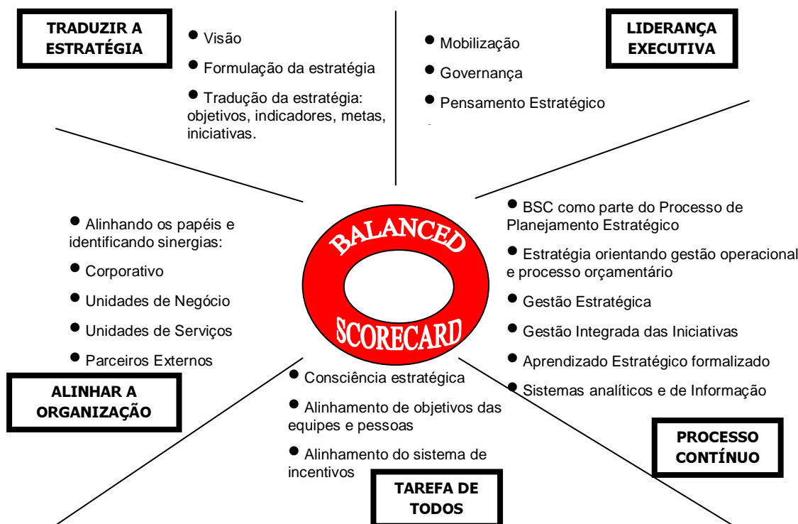
Figura 1 - Os princípios de uma organização orientada à estratégia.

Uma organização orientada para estratégia apresenta as seguintes características: