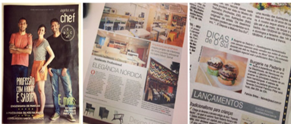
Figura 1. Reportagens sobre a Padarie

Mais recentemente, em 2014 a empresa foi reconhecida pela Revista Veja (Comer & Beber, 2014), como a melhor padaria de Porto Alegre. Essa premiação ajudou a fortalecer a marca na região, atraindo a atenção de investidores em potencial. Depois da aceitação da empresa pelos clientes, investidores procuraram as sócias para propor soluções para a expansão da empresa. A seguir, exemplos de reportagens publicadas pelo Jornal Zero Hora sobre a empresa (a seção referências indica os links para consulta das reportagens na íntegra).